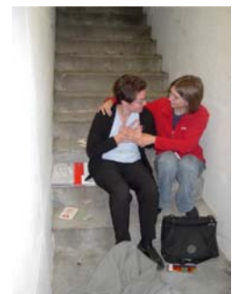
Betreuung eines Herzinfarktpatienten

Der Samariterverein Sins wurde 1943 gegründet und zählt heute 37 Aktivmitglieder und 39 Passivmitglieder, aus allen Alters- und Berufsgruppen. Der Samariterverein Sins bezweckt die Förderung des Samariterwesens und die Erfüllung humanitärer Aufgaben im Sinne des Rotkreuzgedankens.