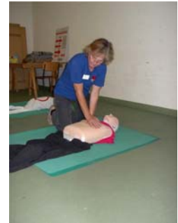
Herz- Lungen- Wiederbelebung (CPR) wird am Phantom geübt.

Bei genügend Interessenten werden wir im 2008 gerne einen öffentlichen Nothilfekurs Refresher anbieten.